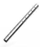
Adapterkit 4 für Füllschuhe 70 und 90

auf Flanschdurchmesser 15 bis 25 mm Art.Nr. 0096030